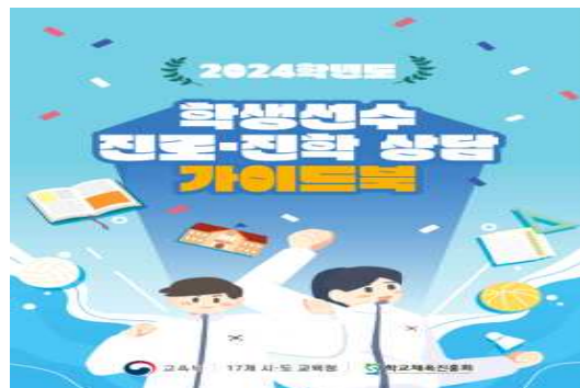
학생선수 진로·진학 상담 가이드북